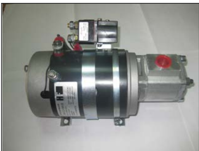
Рисунок 1.1 Электродвигатель в сборе с насосом