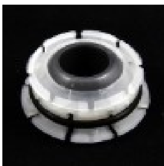
9808582 Шарнир перекрестных тяг HIAB