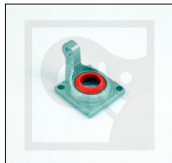
9845313 Кронштейн рычага распределителя HIAB