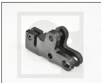
3403785 Кронштейн рычага HIAB