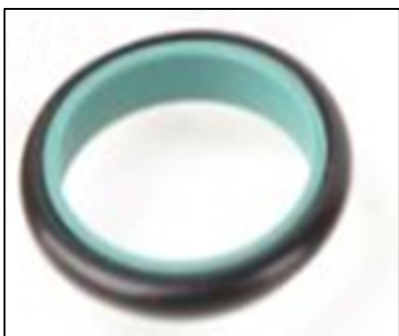
9830901 Уплотнение золотника HIAB V91 ф22мм