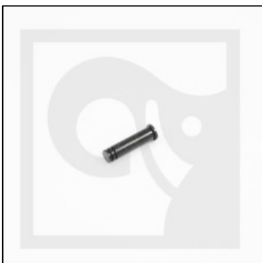
3905853 Штифт рычага HIAB