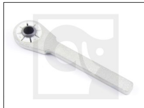
9808604 Тяга с шарниром в сборе HIAB